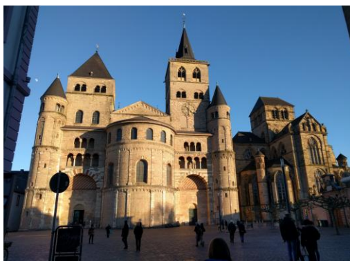
Dom und Liebfrauenkirche