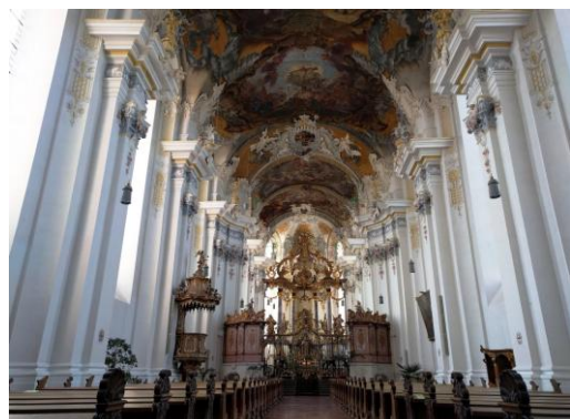
Basilika St. Paulin