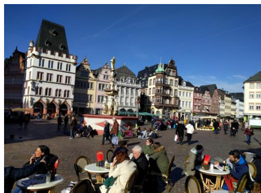
Hauptmarkt mit Petrusbrunnen, Marktkreuz und Steipe