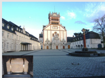
Trier St. Matthias