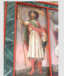
St. Jakobus (Ev. Kirche Starkenburg)