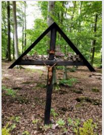
Grenderich > Bullay