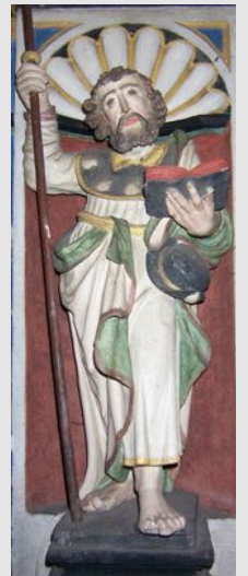
St. Jakobus (Stiftskirche St. Kastor, Karden)