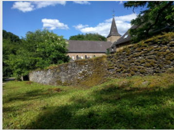
Kloster Maria Engelport